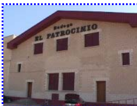
COOPERATIVA EL PATROCINIO