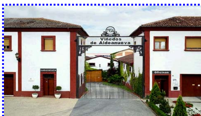
VIÑEDOS DE ALDEANUEVA